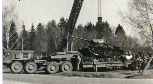
▲ Valga lähedal postamendil purustatud T-34/85 asemele toodud tank asub nüüd Valga isamaalise kasvatuse püsiekspositsioonis.

ha kõikvõimalike detailide ning juba enne Mäksale viimist puudusid paljud vajalikud osad. Sealt Heino Prost selle paljureisinud ja huvitava ajalooa eksponaadid oma sõnul surumastu ära päästiski. Peab veel mainima, et see tank on ikka ühes mürsukindlas õnnesärgis sündinud, sest kuigi ta osales tõsisest lahingutes, ei saanud see ühtegi märkimisväärset tabamust.