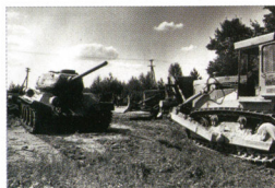
Võru-Kose tank-monument oli sõidukorras ja liikus omal jõul ausamba betoonalusele, kus peale sissepääsude kinnikeevitamist tardus mälestusmärgiks. Monument avati 1979. aasta 11. augustil kell 13.00 (vasakpoolsel fotol). See on ainuke tank, mille tänane Eesti kaitseväge on hävitanud – tõi, mitte lahingus, vaid polügoonil.