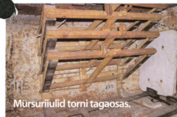
Mürsuriüld torni tagaosas.

► Juhi iste on asendatud mugavam ja suurema „tooliga” ning selle kõrval paiknenud kuulipilduri iste on eemaldatud. Paremal asuva kuulipildurija muna all on näha parandatud koht, kust mürsk on soomusest läbi tulnud. Kui akul võhm väljas, siis sai ja saab ka praegu tanki käivitada suruõhuga. Fotol olevad balloolid on originaalid.