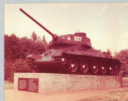
▲ Valga esimene postamenditank on esialgses ilus.

◀ Seda tanki ei purustatud Teise maailmasõja lahinguväljal, vaid 1990. aasta aprillikuus Valga lähedal postamendil. Eriti suuri vigastusi tekitati tanki tagaosale, mis deformeerus ja purunes sõjavõrd, et sõjamasin tuli vanarauaks minema vedada.