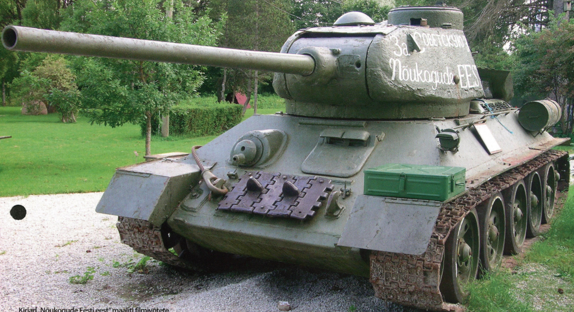
Kirjad „Noukogude Eesti” maalrid filmivõtete „Surnupealkuu sõdurid” jaoks. Sellise kirjaga tankid jõudsid 1944. aasta septembrikuus Tallinnasse. Sindi-Lagedi T-34/85 kehastas filmis ühte neist tankidest.